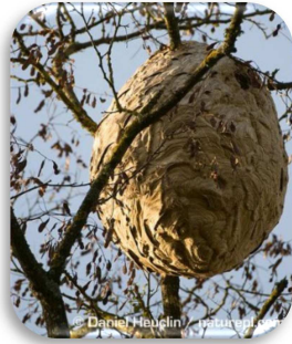
Nest der Asiatischen Hornisse