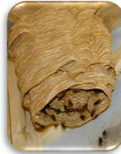
Nest der Europäischen Hornisse

Nester der Asiatischen Hornisse erreichen auf ihrem Entwicklungshöhepunkt bis zu 10.000 Brutzellen und 1.000 bis 2.000 Individuen. Am Ende des Sommers beginnt die Aufzucht von jungen Hornissenköniginnen und Drohnen, um die neue Generation zu gründen.