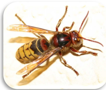
Europäische Hornisse