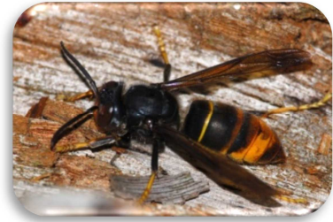
Asiatische Hornisse