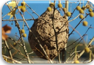
Nest der Asiatischen Hornisse