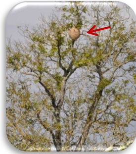
Nest der Asiatischen Hornisse