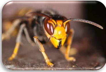
Asiatische Hornisse

– ein neuer Bienenschädling bedroht die Bienenvölker –